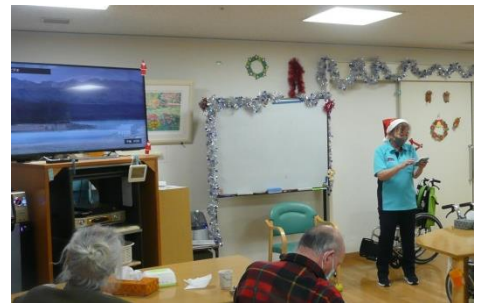
司会・進行は竹村スタッフ